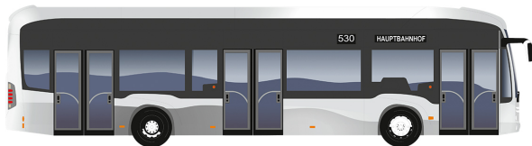
eCitaro 3 deuren

Lengte [mm]: 12.135 Draaicirkel [mm]: 21.214