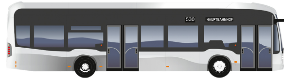
eCitaro 2 deuren

Lengte [mm]: 12.135 Draaicirkel [mm]: 21.214