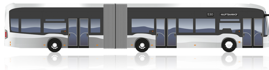
eCitaro G 3 portes

Longueur [mm]: 18125 Hauteur [mm]: 3400 Diamètre de braquage [mm]: 22970 Largeur [mm]: 2550