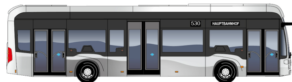
eCitaro fuel cell 3 porte

Lunghezza veicolo [mm]: 12'135 Diametro di sterzata [mm]: 21'214 Altezza veicolo [mm]: 3'450 Larghezza veicolo [mm]: 2'550