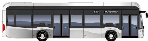
eCitaro fuel cell 2 porte

Lunghezza veicolo [mm]: 12'135 Diametro di sterzata [mm]: 21'214 Altezza veicolo [mm]: 3'450 Larghezza veicolo [mm]: 2'550