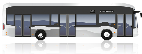
eCitaro 3 puertas

Longitud [mm]: 12.135 Altura [mm]: 3.400 Círculo de viraje [mm]: 21.214 Anchura [mm]: 2.550