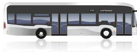
eCitaro 2 Πόρτες

Μήκος [mm]: 12.135 Ύψος [mm]: 3.400 Κύκλος στροφής [mm]: 21.214 Πλάτος [mm]: 2.550