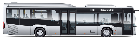
Citaro LE Ü

Lunghezza veicolo [mm]: 12.170 Diametro di sterzata [mm]: 21.568