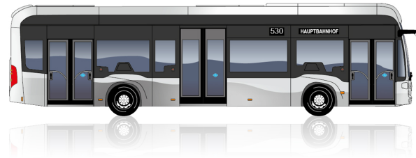
eCitaro fuel cell 3 Türen

Länge [mm]: 12.135 Wendekreis [mm]: 21.214 Höhe [mm]: 3.450 Breite [mm]: 2.550