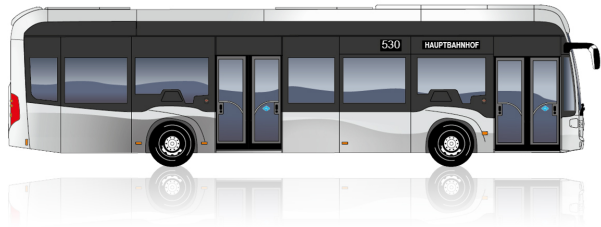
eCitaro fuel cell 2 Türen

Länge [mm]: 12.135 Wendekreis [mm]: 21.214 Höhe [mm]: 3.450 Breite [mm]: 2.550